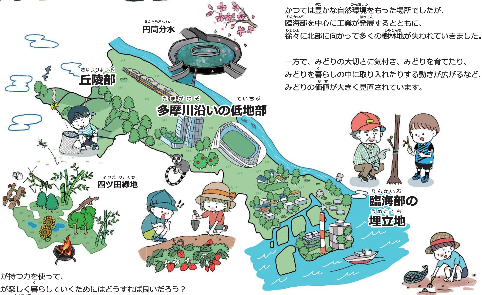
えんとうぶんすい 円筒分水